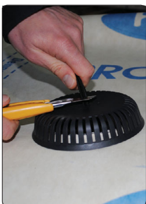
Stripsen skæres af, ca. 1 cm over dækslet