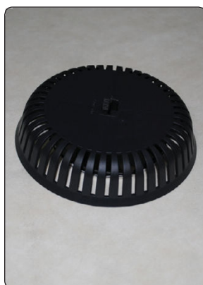
Færdigmonteret, set udefra Afprøv om yderdelen slutter helt tæt til undertaget.