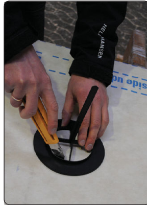
Marker og skær hul i undertaget

KimaAir OUTSIDE/IN Ventilstuds er til udluftning af kolde tagrum.