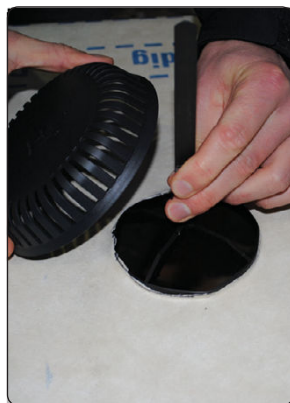
Hold fast i stripen, og monter overdelen.