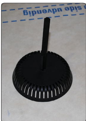
Ventilstuds er nu monteret. Undertag må ikke være ujævnt eller foldet, undgå montering i overlæg ved fast undertag