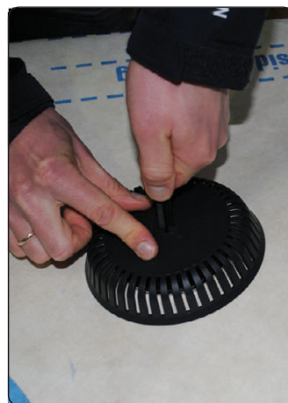
Overdelen presses ned mod undertaget, det er vigtigt at begge dele strammes hårdt sammen for at sikre tæthed til undertag.