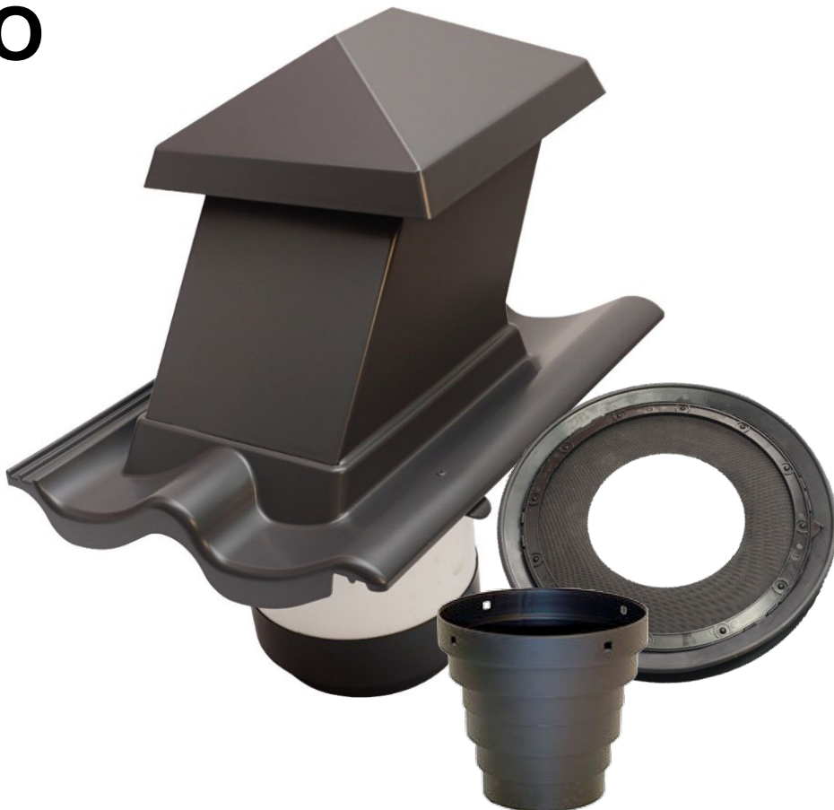
Tryktab HV15x15 med rundt ISO-rør (Luft ud)

Skal pakkes ud af plastposen ved placering i sollys.